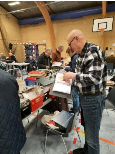
Nille på jagt

Bestyrelsen takker for den hjælp, som flere medlemmer bidrog med, med opstilling og nedtagning af borde og stole, samt pasning af indgang og stand. Og tak til Åse og Bente, der passede caféen så flot.