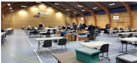
De første kræmmere stiller op