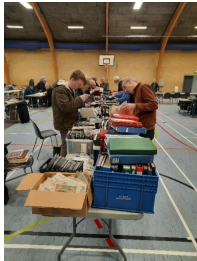
Kassevis af albums til salg