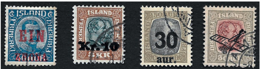
Eksempler på provisoriske frimærker – i 1920'erne kom en række i forbindelse med takstændringer.

Den mest pompøse islandske udgivelse er en 21 frimærke stor fejring af 1000 året for Islands parlament i 1930 (AFA 125-140 og 142-146). Alle islændinge er pavestolte over Altinget (på