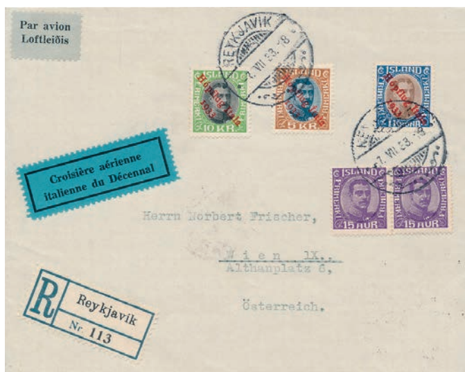
Brev til Østrig befordret med Balbo flyvningerne. Solgt på deres sidste auktion for EUR 3.600 plus omkostninger.