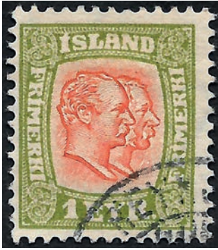
1 eyrir værdien i Dobbelthoved serien fra 1907.