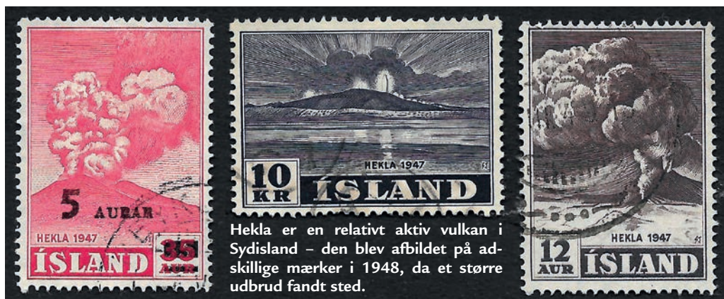
Hekla er en relativt aktiv vulkan i Sydland – den blev afbildet på adskillige mærker i 1948, da et større udbrud fandt sted.