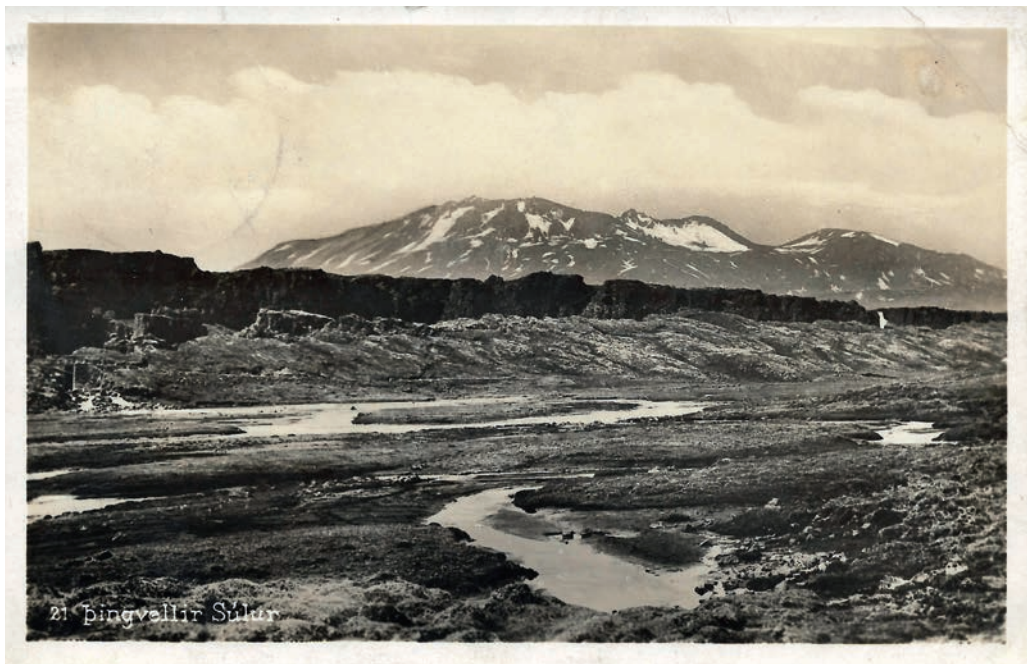
Postkort som viser stedet, hvor Altinget afholdt sine møder før man fik egne lokaler!