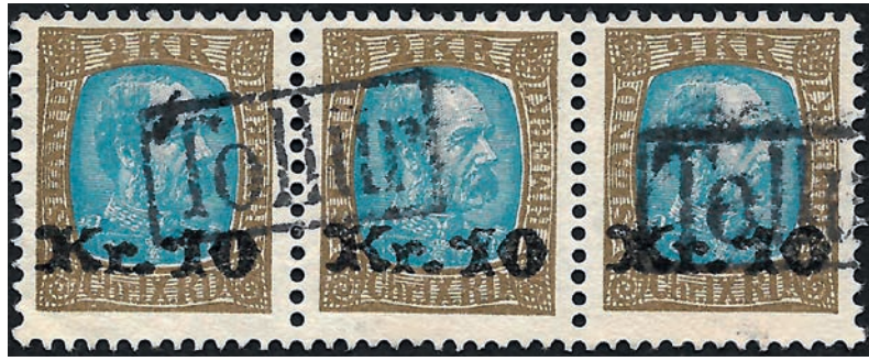
10 kronur på 2 kronur provisorium i trestribe afstemplet med "TOLLUR" (fiskalt). Sådanne frimærker er betydeligt mindre værd end postalt afstemplede.

lighedsstemplede er nogle gange lidt dyrere end de ubrugte. Hvis man derfor vil købe skillingsmærkerne stemplet bør man have attest på dem.