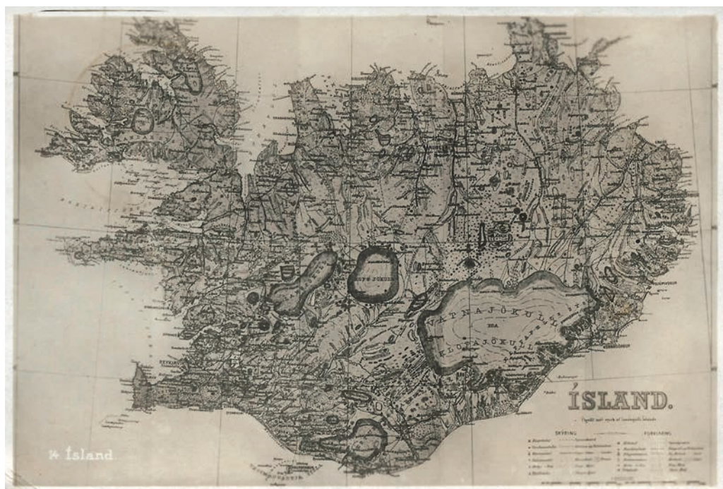
Postkort fra 1932 med kort af Island.

I filateliens ungdom brugtes danske frimærker på Island. Disse kan betragtes som forløbere,