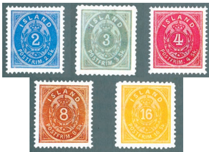
Den første udgave i skilling.

Den første frimærkeudgave kom 1. januar 1873 med en serie på fem frimærker i skilling. Disse frimærker ligner de danske tofarvede, men de er lidt enklere og uden de typiske rammer, som er de tofarvede store "styrke". De blev først udgivet med takning 14 x 13 1/2. Senere kom et nyt 3 skilling frimærke og nye 4 og 16 skilling mærker med 12 3/4 linjetakning (AFA 1-5). Frimærkerne blev trykt af H.H. Thiele i