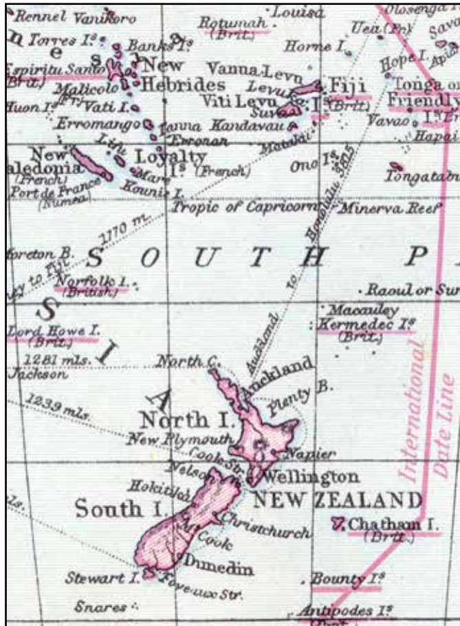
Tonga-øerne ses her i øverste højre hjørne. Dette kort og kortet på foregående side stammer fra et gammelt atlas: Collins Geographical Est. i Glasgow. Kortene er fra ca. midten af 1930erne

Brevet vidner om den vigtighed, et brev havde den gang, og om den nidkærlighed postvæsenet udøvede i forsøget på at få afleveret alle breve.