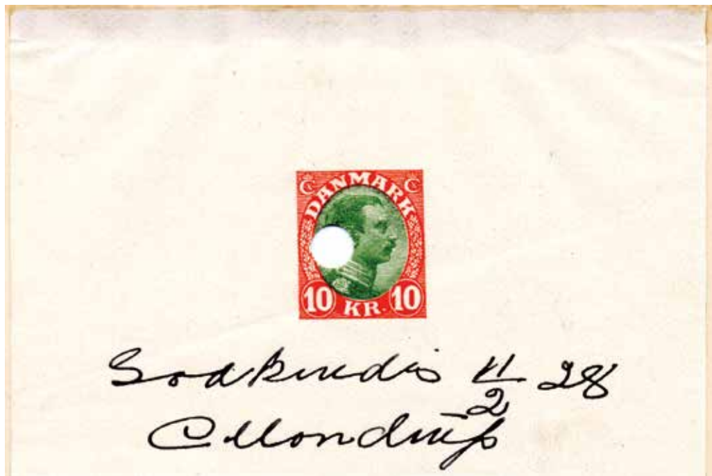
Den godkendte farveprøve til 10 kr.s mærket signeret af Generaldirektør Mondrup 11. februar 1928

Bogholderikontor. Det er dateret 28. oktober 1927 og lyder: