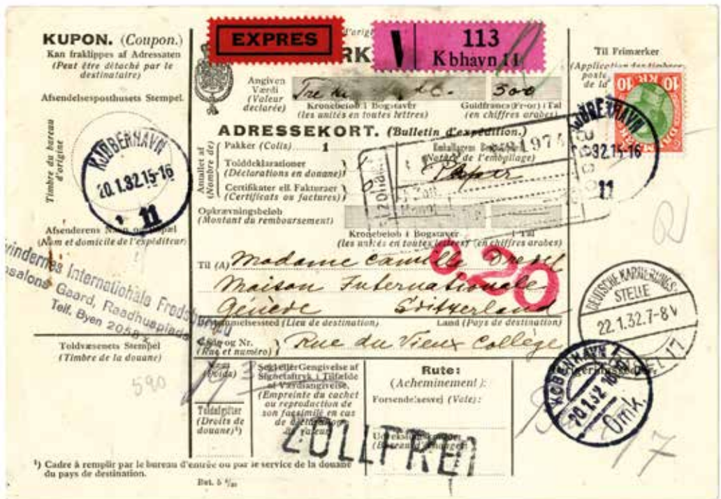
En mulig anvendelse for 10 kroners mærket var på adressekort på tunge pakker til udlandet. Her værdipakke til Schweiz 19,3 kg med ekspresudbringning. Takst 15-20 kg: 900 øre + ekspresgebyr 60 øre plus værdiporto 25 øre + 15 øre pr. 300 Franc = 1000 øre

I min egen forskning i bogtrykte Christian X frimærker har jeg på intet tidspunkt gidet spille min tid med at undersøge ,