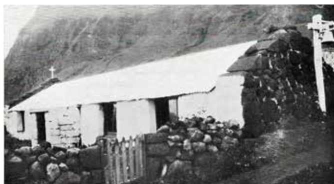
Knud Andersens billede fra 1930 af kirken på øen som er motivet på 1 shilling værdien

4d mærket i tyrkisblå og dytblå viser Tristan da Cunha set fra sydvest. Øen er ca. 45 km i omkreds. Vulkanen rejser sig ca. 2000 meter over havets overflade. I krateret er der en sø. Den eneste rigtige by på øen hedder Edinburgh efter the duke of Edinburgh (Dronnings Victorias søn nr. 2), som besøgte øen i 1867 som kommandør på skibet Galatea. Dette skib vises iøvrigt på 4 1/2 d. værdien i skibsserien fra 1965. Værdien 1 shilling viser øens kirke, som Knud Andersen