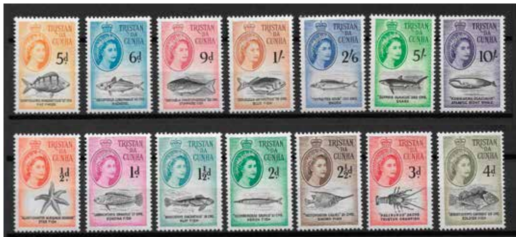
Serie fra 1960 - SG nr. 28-41 som viser forskellige havdyr, fisk mm fra havet omkring Tristan da Cunha. Udgaven fra 1960 er i engelsk mønt