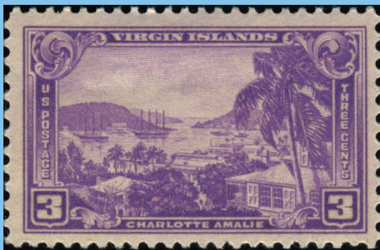
Frimærke fra USA med motiv fra de tidligere Dansk Vestindiske Øer, Charlotte Amalie.

Dansk Vestindien er et meget spændende samleområde, men desværre også meget dyrt.