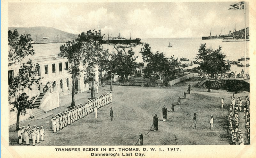
TRANSFER SCENE IN ST. THOMAS, D. W. I., 1917. Dannebrog's Last Day.