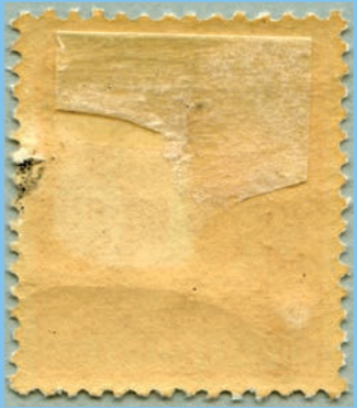
Postfrisk med lim, men med hængselrest.