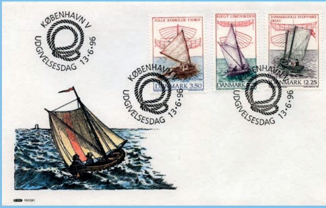
Førstedags kuvert med flotte motivstempler. I nogle samlinger pynter en sådan kuvert.