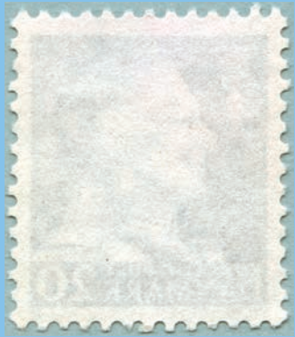
Ustemplet med manglende lim.