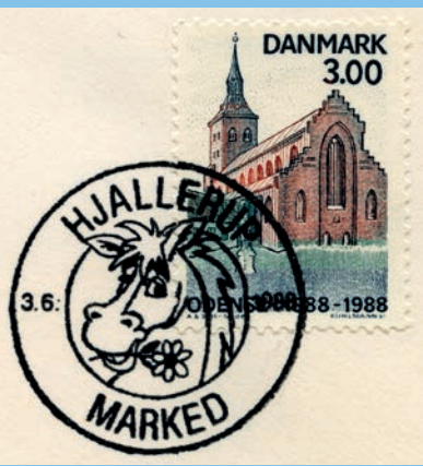
Eksempel på et særstempel som man heller ikke skal klippe af konvolutten.