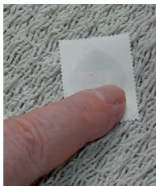
Billede 6: Når al benzinen er væk, så grides bagsiden med en smule talkum - så meget, at mærket ikke længere er selvklæbende.

Som det sidste kan alt overskydende talkum fjernes med normal vask i vand.