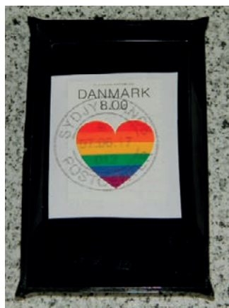
Billede 2 viser, at klippet skal være lidt mindre end den her sorte vandmærkesøger.