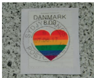
Billede 1: Et af de nyeste selvklæbende frimærker på klip.

Her er fremgangsmåden for vask af nye selvklæbende mærker.