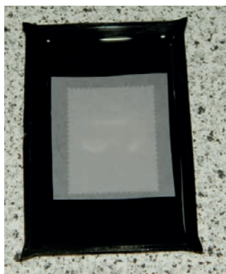
Billede 4: Klippet er lagt i en lille smule benzín - Når klippet er gennemvædet, så pilles mærket forsigtigt af.