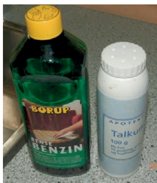
Billede 3: Renset benzín og talkum indgår i opskriften.