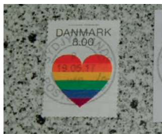
Billede 7: Her ses det færdige resultat.

Mærket lægges i tørrebog/telefonbog og presses.